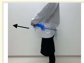
⑤ 矢印の方向へ強く引っ張り腰紐を引きちぎる