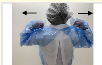
① 首元をしっかり持って左右に引っ張ってちぎる