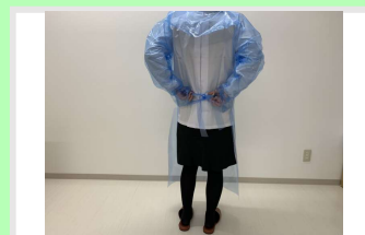
⑥ 後ろでしっかり結ぶ