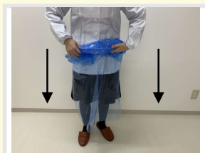
④ 下向きに巻くようにして脱いでいく