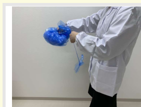
⑥ 小さく畳んで廃棄する