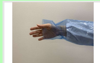
③ 袖に空いている穴に親指を入れる