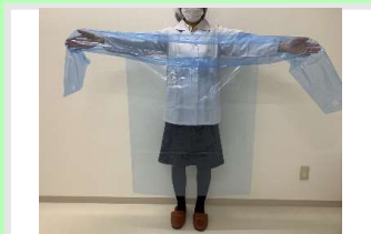
② 両腕を広げて袖に手を通す