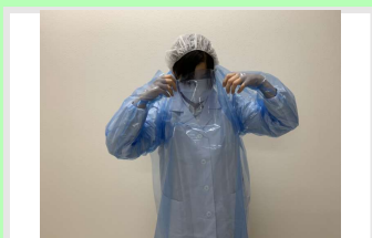
④ 首元を持って頭を通す