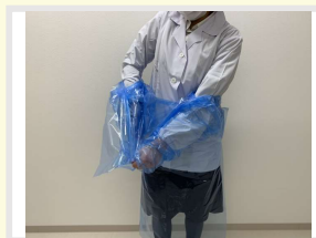
③ 袖から両腕を抜く