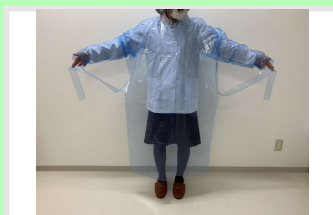
⑤ ミシン目に沿って腰紐をちぎる