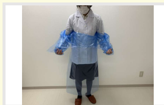
② 表面の汚れが手につかないように脱ぐ